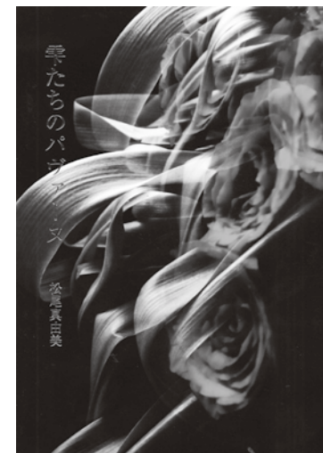
松尾真由美 詩集『雫たちのパヴァーヌ』 アジア文化社刊 送料別 1760円(税込)

詩集『燭花』(思潮社) 詩集『密約—オブリガート』(思潮社) 第52回H氏賞受賞 詩集『揺籃期—メッサ・ヴォーチェ』(思潮社) 詩集『彩管譜—コンチェルティーノ』(思潮社) 詩集『腫濼』(思潮社) 詩集『不完全協和音 consonanza inperfetto』(思潮社) 詩集『雪のきらめき、火花の湿度、消えゆく蕊のはるかな記憶を』(思潮社) BOX詩集個展用パンフレット詩集『装飾期、箱の中のひろやかな物語を』 現代詩文庫『松尾真由美詩集』(思潮社) アンソロジー『現代詩最前線』(北溟社) 『小野十三郎を読む』(思潮社) 『短篇集 夜』(驢馬出版) 『ふるさと文学さんぽ 北海道』(大和書房) 詩集『花章—ディヴェルティメント』(思潮社) 詩集『雫たちのパヴァーヌ』(アジア文化社) 詩集『多重露光』(思潮社) 北海道新聞文学賞(詩部門)選考委員