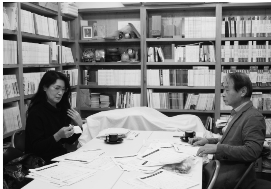
現代詩賞選考会風景 2020.11.3 アジア文化社図書室で

詩は現実との対話であり、世界と生身で向かい合うことでもある。この世界には、もつと侮蔑し、憎み、呪い、叫びたいことがたくさんある。呪いを深く重ねて初めて祈りに到達するのかもしれない。それほど断罪したい運命が満ちている。この世界が平和で平穩であるはずがない。命という限りあるものの中に閉じ込められているからこそ、声を投げて何かにぶつきたい言葉の衝動がある。その弾丸で現実を突き破って欲しい。そこに永遠に通じる精神の華が咲くことを信じている。